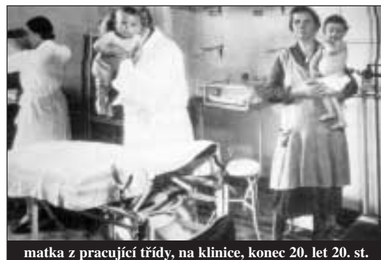
matka z pracující třídy, na klinice, konec 20. let 20. st.

ovanou sexuální zručnost s mužností fašistického systému. Samolibě se posmíval impotenci antifašismu za jeho státní formu označil republikánství a jeho hlavním příkladem byl současný největší nepřítel, demograficky slabá třetí francouzská republika. Do poloviny 20. let zůstala ikonografie squadristy věrná obrázku futuristy Maria Carliho z roku 1919. Se svými „horoucně hrdýma bezelstnýmá očima“ a „smyslně energickými ústy připravenými vášnivě líbat, sladce zpívat a panovitě rozkazovat,“ byl tzv. fašista prvního období rozhodně svobodný muž; jeho „střízlivá elegance“ mu umožňovala být připraven na běh, boj, útek, tanec a vyburcování davu. 6 Mladí fašisté stále absolvovali své první sexuální zážitky v case