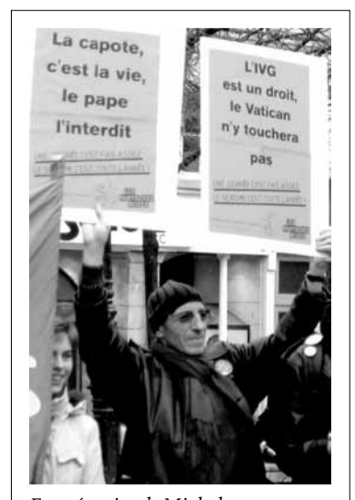
En mémoire de Michel